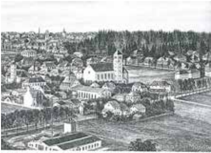
Haar im 19. Jahrhundert. Die Kirche ist die Hauptkirche und die Kirche im Vordergrund. Die Gebäude sind die Häuser der Arbeiter. Die Kirche ist die Hauptkirche und die Kirche im Vordergrund. Die Gebäude sind die Häuser der Arbeiter.